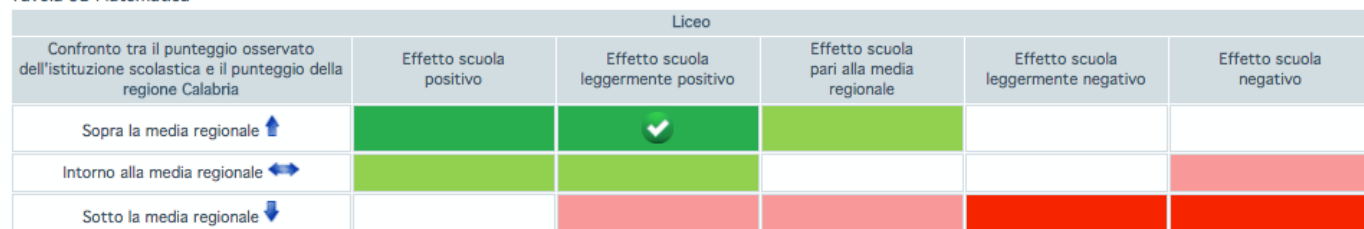
Tavola 9B Matematica